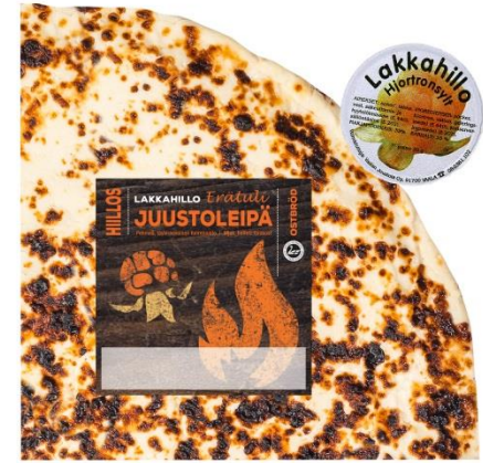
Vaalan juustolan Erätuli - juustoleipä