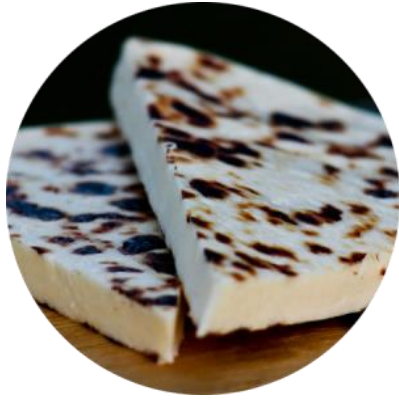
Heikkilän juustolan leipäjuusto